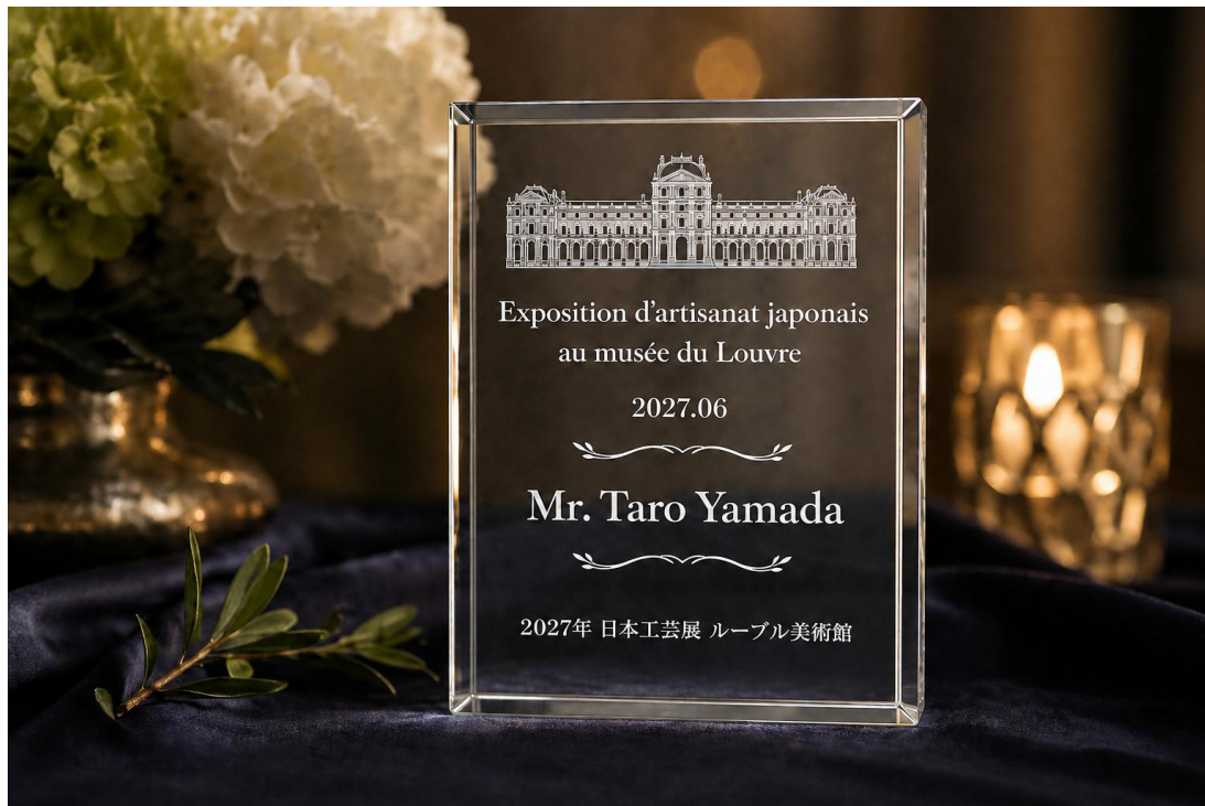
参加賞楯イメージ

副賞として受賞者10名の商品は 1か月間パリのTAKUMI店で テスト販売を行います。