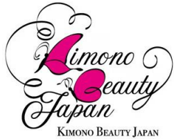
一般社団法人 きものビューティージャパン協会