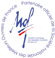
フランス国家最優秀職人 全国協会